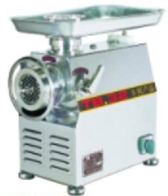
TB32 绞肉机 Meat Mincer

额定电压 Rate Voltage: ~220v 额定频率 Rate Frequency: 50hz 电机功率 Power: 0.65kw 防水等级 Ipno: Ipx1 生产能力 Productivity: 220kg/h 整机重量 Net Weight: 36kg 外型尺寸 Dimension: 445x250x460mm