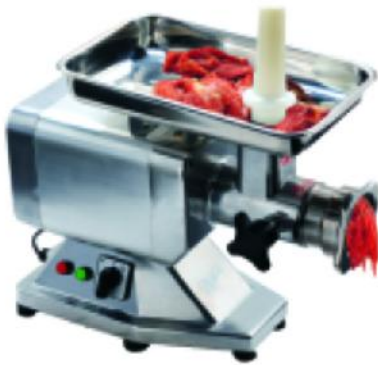
HM-12 额定电压 Rate Voltage:~230V/110V 额定频率 Rate Frequency:50HZ/60HZ 电机功率 Power:0.85kw 整机重量 Net Weight:21.5kg 毛重 Gross Weight:22.5kg 外型尺寸 Dimension:602x262x454mm