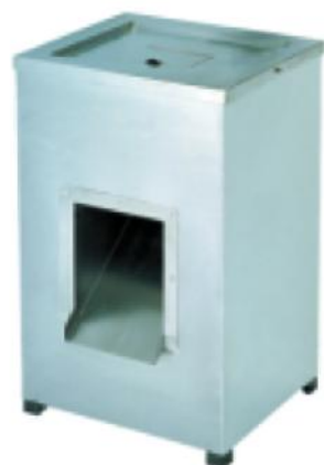
DQ-1 单切肉片机 Meat Cutter

额定电压 Rate Voltage: ~220v 额定频率 Rate Frequency: 50hz 电机功率 Power: 0.65kw 切片能力 Slice Capability: 300kg/h 切片厚度 Slice Thickness: 3.5mm 净重 Net Weight: 51kg 外型尺寸 Dimension: 380x336x585mm