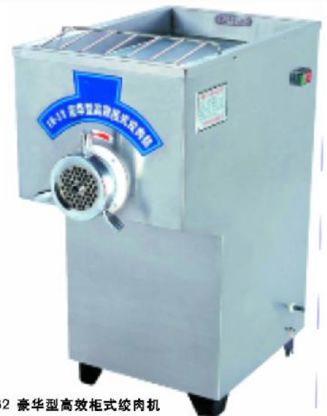
JR-32 豪华型高效柜式绞肉机