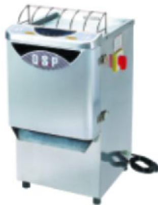
QSP Shredder Machine

额定电压 Rate voltage: 3~380V 额定频率 rate frequency: 50HZ 电机功率 power: 1.5kw 生产能力 Production capability: 500--1000kg/h 切片厚度 slice thickness: 2x2mm~8x8mm 整机重量 net weight: 150kg 外型尺寸 dimension: 900x680x880mm