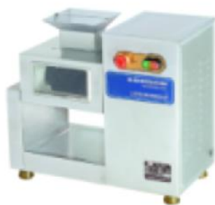
ZQ-130 豪华型台式切肉机 Table Type Delux Meat Grinder

额定电压 Rate Voltage: ~220v 额定频率 Rate Frequency: 50hz 电机功率 Power: 0.75kw 生产能力 Productivity: 125kg/h 净重 Net Weight: 47kg 整机重量 Dimension: 500x380x450mm 切片厚度 Slices Thickness: 2.6mm