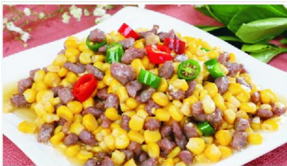
QRD 鲜肉切丁机 QRD Shredder Machine

额定电压 Rate voltage: ~380V 额定频率 rate frequency: 50HZ 额定功率 Rated Power Input: 2.2kw 电机功率 Electromotor Power: 1.5kw 切丁规格 7x7/10x10/14x14mm 防水级别 IPNC: 1PX1 整机重量 net weight: 380kg 外型尺寸 dimension: 1215x990x735mm