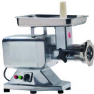
HM-22 额定电压 Rate Voltage:~230V/110V 额定频率 Rate Frequency:50HZ/60HZ 电机功率 Power:1.1kw 整机重量 Net Weight:23.7kg 毛重 Gross Weight:24.7kg 外型尺寸 Dimension:602x262x454mm