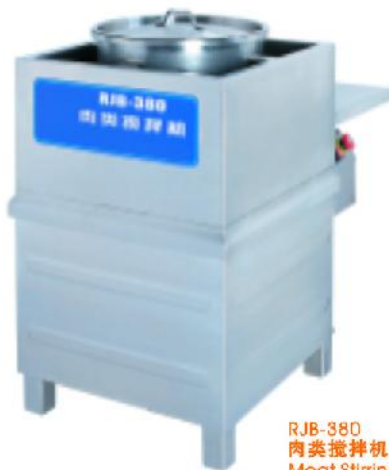
RJB-380 肉类搅拌机 Meat Stirring Machine

额定电压 Rate Voltage: 3~380v 额定频率 Rate Frequency: 50hz 电机功率 Power: 1.5kw 防水等级 Ipno: Ipx1 生产能力 Productivity: 320kg/h 整机重量 Net Weight: 71kg 外型尺寸 Dimension: 540x330x530mm