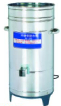
TS-275 不锈钢脱水机 Dehydration Machine

额定电压 Rate voltage: ~220V 额定频率 rate frequency: 50HZ 电机功率 power: 0.55kw 切片能力 slice capability: 100-300kg/h 切片厚度 slice thickness: 1-5mm 切丝能力 shredder capability: 100-300kg/h 切丝粗细 shred thickness: 3.5x1-3.5mm 2.2x1-2.2mm 整机重量 net weight: 46kg 外型尺寸 dimension: 440x360x720mm