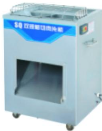
SQ 双规格切肉片机 Meat Cutter

额定电压 Rate Voltage: ~220v 额定频率 Rate Frequency: 50hz 电机功率 Power: 0.65kw 切片能力 Slice Capability: 300kg/h 切片厚度 Slice Thickness: 3.5mm 净重 Net Weight: 51kg 外型尺寸 Dimension: 380x336x585mm