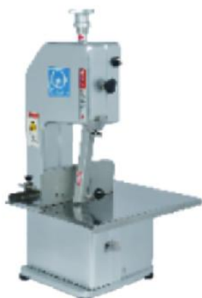
富士鲨 20 型 WAB-20C-2A WAB-20C-3A