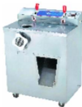
JQ-2 绞切肉机 Meat Cutter And Slicer

额定电压 Rate Voltage: ~220v 额定频率 Rate Frequency: 50hz 电机功率 Power: 0.75kw 额定输入功率 Rated Power Input: 1.1kw 生产能力 Productivity: 200-300kg/h 切片厚度 Slice Thickness: 3.5mm 净重 Net Weight: 78kg 整机重量 Dimension: 510x410x800mm