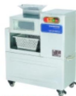
ZQ-180 豪华型切肉机 Delux Meat Cutter

额定电压 Rate Voltage: ~220v 额定频率 Rate Frequency: 50hz 电机功率 Power: 0.65kw 生产能力 Productivity: 500kg/h 净重 Net Weight: 66kg 整机重量 Dimension: 595x350x530mm 切片厚度 Slices Thickness: 3.5mm