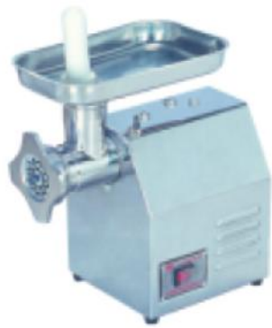
TB-12 绞肉机 Meat Mincer

额定电压 Rate Voltage: ~220v 额定频率 Rate Frequency: 50hz 电机功率 Power: 0.55kw 生产能力 productivity: 120kg/h 整机重量 Net Weight: 25kg 外型尺寸 Dimension: 410x230x410mm