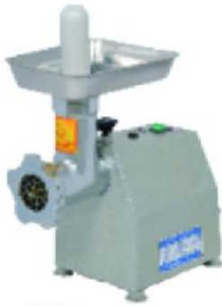
MM8 额定电压 Rate Voltage:~220V 额定频率 Rate Frequency:50hz 电机功率 Power:0.55kw 生产能力 productivity:80kg/h 整机重量 Net Weight:16kg 外型尺寸 Dimension:345x190x355mm 肉板孔径 meat plate aperture:6mm 8mm