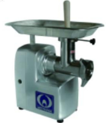
WMG-M22/12C-3 额定电压 Rate Voltage:~380V 额定频率 Rate Frequency:50HZ/60HZ 电机功率 Power:0.75kw 整机重量 Net Weight:33.2kg 外型尺寸 Dimension:500x300x455mm