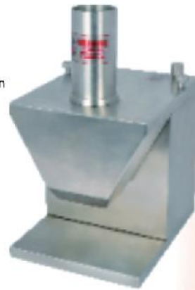
切香肠机 Sausage slicer ITEM-822001 (C-Knife) 规格 Size:285x480x455mm 电压 Voltage:220V-240V/50Hz 功率 Power:0.55kw 整机重量 Net Weight:8kg