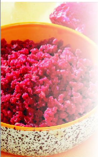
JR-22 绞肉机 Meat Mincer

额定电压 Rate Voltage: ~380v 额定频率 Rate Frequency: 50hz 额定功率 Rated Power Input: 3kw 生产转速 Production Speed: 270r/min 电机功率 Power: 2.2kw 整机重量 Net Weight: 126kg 防水级别 IPNO: 1PX1 外型尺寸 Dimension: 855*815*860mm