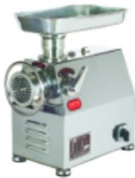
TB22 绞肉机 Meat Mincer

额定电压 Rate Voltage: ~220v 额定频率 Rate Frequency: 50hz 电机功率 Power: 0.55kw 生产能力 productivity: 120kg/h 整机重量 Net Weight: 25kg 外型尺寸 Dimension: 410x230x410mm