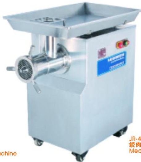
JR-42 绞肉机 Meat Mincer