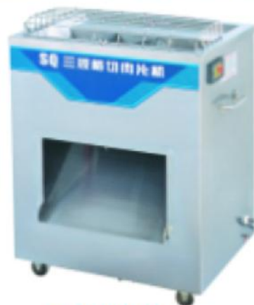
SQ 三规格切肉片机 Meat Cutter

额定电压 Rate Voltage: ~220v 额定频率 Rate Frequency: 50hz 电机功率 Power: 1.1kw 生产能力 Productivity: 600-800kg/h 切片厚度 Thickness: 3.5mm 5mm 净重 Net Weight: 78kg 外型尺寸 Dimension: 600x460x770mm