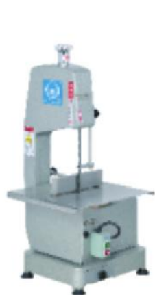
富士鲨 220 WHFB-220-2A