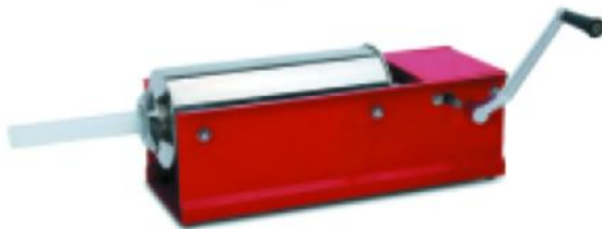
灌肠机 Enema machine CH系列