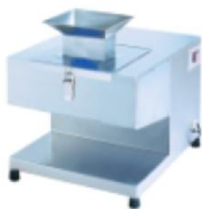
JZ 台式双切肉片机 Meat Cutter

额定电压 Rate Voltage: ~220v 额定频率 Rate Frequency: 50hz 电机功率 Power: 0.75kw 生产能力 Productivity: 125kg/h 净重 Net Weight: 47kg 整机重量 Dimension: 500x380x450mm 切片厚度 Slices Thickness: 2.6mm