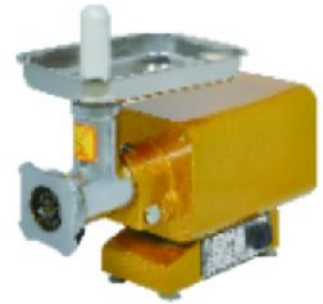
MM-12A 额定电压 Rate Voltage:~220V 3~380V 额定频率 Rate Frequency:50hz 电机功率 Power:1.1kw 生产能力 productivity:120kg/h 整机重量 Net Weight:24kg 外型尺寸 Dimension:480x210x360mm 肉板孔径 meat plate aperture:6mm 8mm