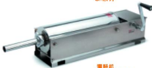
灌肠机 Enema machine SH系列