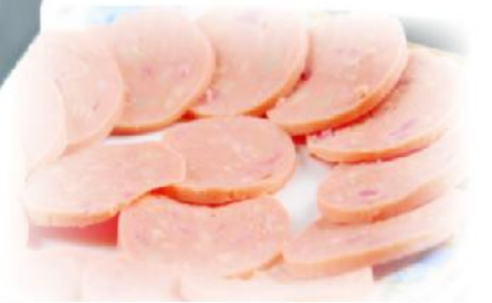
ITEM-822002 (S-Knife) 规格 Size:285x480x455mm 电压 Voltage:220V-240V/50Hz 功率 Power:0.55kw 整机重量 Net Weight:8kg