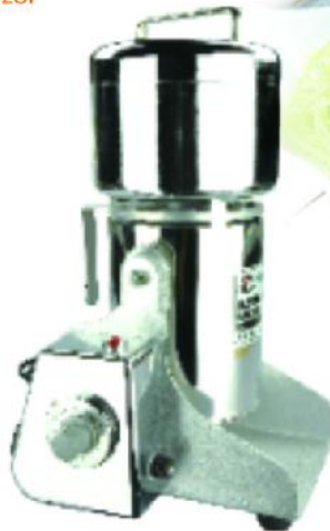
WF-04B WF-10B WF-07B WF-15B