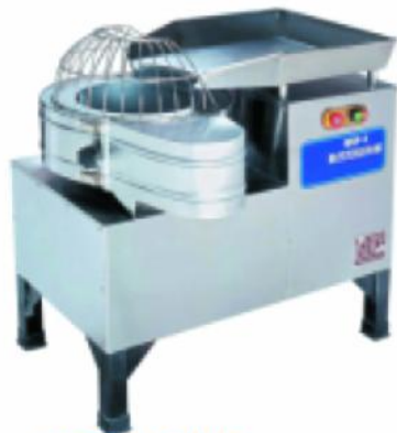
QSP-1 卧式切丝片机 QSP-1 Fruit Cutter

额定电压 Rate voltage: 3~380V 额定频率 rate frequency: 50HZ 电机功率 power: 1.5kw 生产能力 Production capability: 500--1000kg/h 切片厚度 slice thickness: 2x2mm~8x8mm 整机重量 net weight: 150kg 外型尺寸 dimension: 900x680x880mm