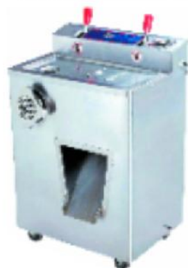
JQ-1 绞切肉机 Meat Cutter And Slicer

额定电压 Rate Voltage: ~220v 额定频率 Rate Frequency: 50hz 电机功率 Power: 1.1kw 生产能力 Productivity: 800kg/h 净重 Net Weight: 94kg 整机重量 Dimension: 720x360x835mm 切片厚度 Slices Thickness: 3.5mm