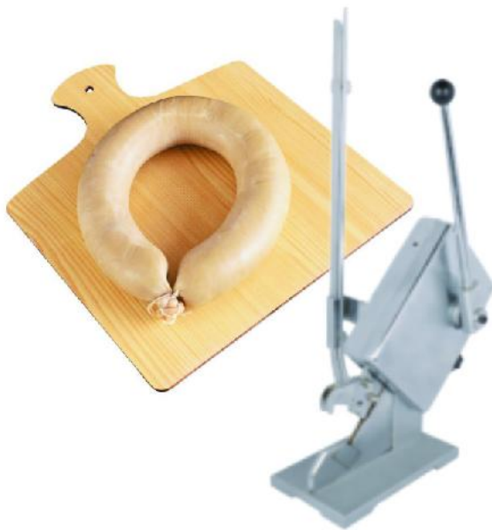
卡扣机 Sausage clipper,tying 98C01 规格 Size:150x350x500mm 整机重量 Net Weight:16kg