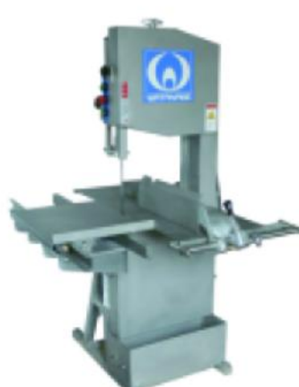
富士鲨 35 型 (滑动) WAB-35C-3A/3C