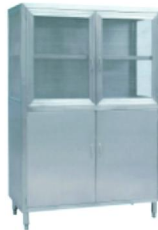
69C08 立式沙网/储物柜 Upright Cabinet