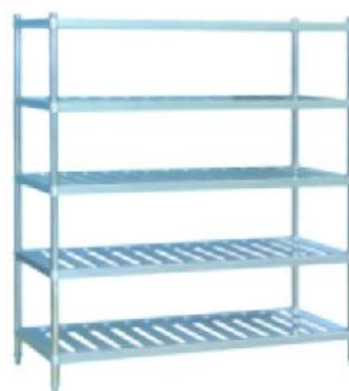
71C09 拆装式磁条五层存放架 Assembling 5 Decks Shelf 立方数 m 3 :0.13 重量 N.W.:30kgs 规格 Size:1100x500x1800mm 尺寸 Measurement:1110x510x220mm