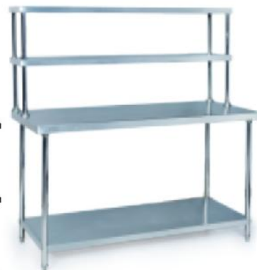
73C11 立方数 m 3 :0.22 重量 N.W.:39kgs 规格 Size:1800x800x850+680mm 尺寸 Measurement:1820x820x150mm