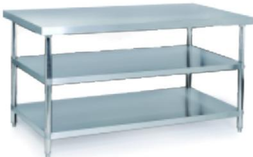
拆装式三层工作台 Assembling 3 Decks Working Table

立方数 m^3:0.22 重量 N.W.:29kgs 规格 Size:1800x800x950mm 尺寸 Measurement:1820x820x150mm