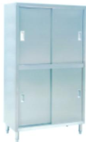
69C07 立式沙网/储物柜 Upright Cabinet