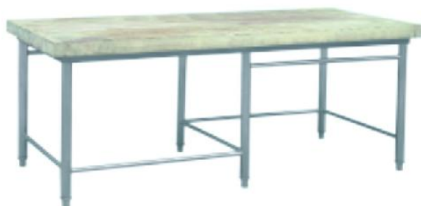
木面案板台 Wood Chopping Board 73C03 尺寸 Measurement:1800x800x850mm