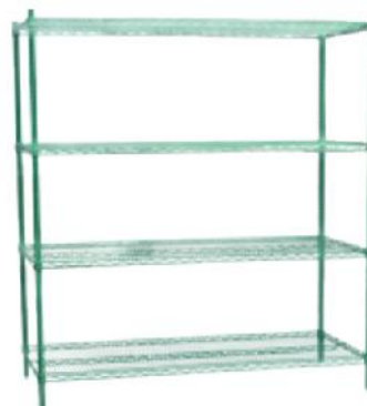
拆装式存放架 Removable Multi-function Storage Rack