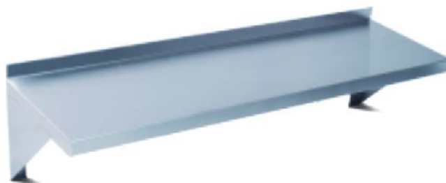
拆装式挂墙层板 Assembling Shelf