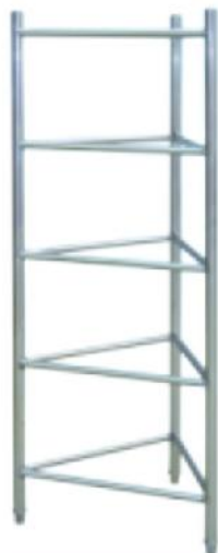
五层蒸笼架 5 Deck Steaming Pan 73C07 立方数 m 3 :0.44 重量 N.W.:8kgs 规格 Size:610x430x1550mm 尺寸 Measurement:620x450x1570mm