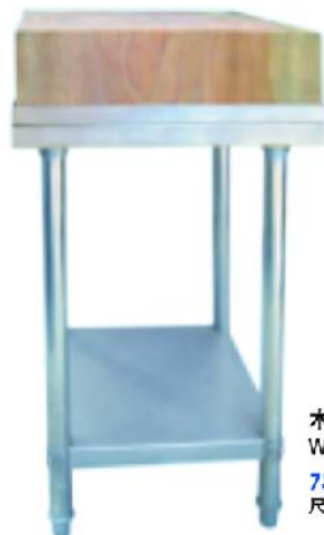
木面案板台 Wood Top Table 73C01 尺寸 Measurement:500x500x900mm