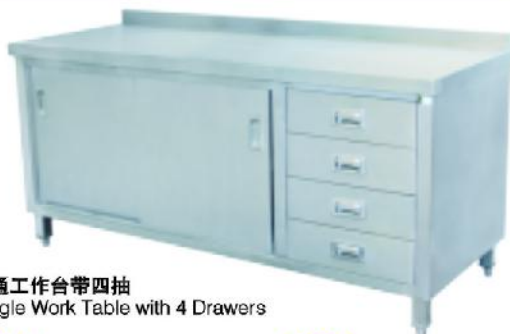
单通工作台带四抽 Single Work Table with 4 Drawers

立方数 m^3:0.45 重量 N.W.:30kgs 规格 Size:1800x700x850mm 尺寸 Measurement:1820x720x320mm