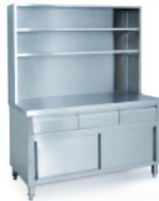
69C05 楼面工作柜带上架 Cabinet With Shelve