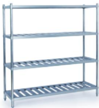
71C01 拆装式磁条四层存放架 Assembling 4 Decks Shelf 立方数 m 3 :0.1 重量 N.W.:22kgs 规格 Size:1100x500x1550mm 尺寸 Measurement:1110x510x180mm