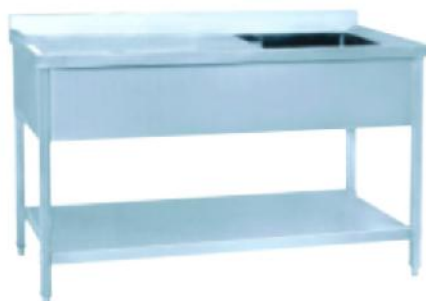
折叠式豪华型单星围板洗刷台 Luxury Folding Single Boarding Wash Table