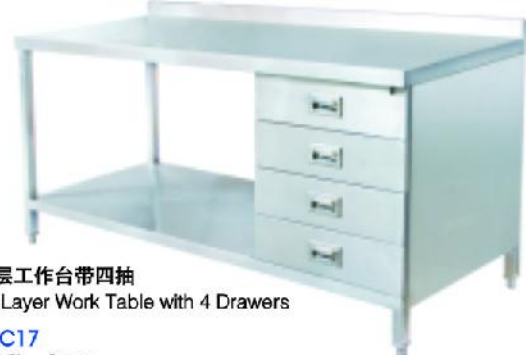
双层工作台带四抽 2-Layer Work Table with 4 Drawers

立方数 m^3:1.52 重量 N.W.:75kgs 规格 Size:1800x700x850mm 尺寸 Measurement:1900x800x1000mm