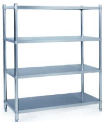
71C07 拆装式四层层板存放架 Assembling 4 Decks Shelf 立方数 m 3 :0.1 重量 N.W.:22kgs 规格 Size:1100x500x1550mm 尺寸 Measurement:1110x510x180mm