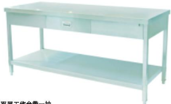
双层工作台带一抽 2-Layer Work Table with One Drawer

立方数 m^3:0.17 重量 N.W.:24kgs 规格 Size:1800x600x850mm 尺寸 Measurement:1820x620x150mm