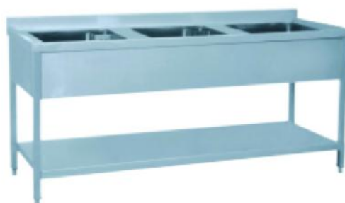
折叠式豪华型三星围板洗刷台 Luxury Folding Three Boarding Wash Table