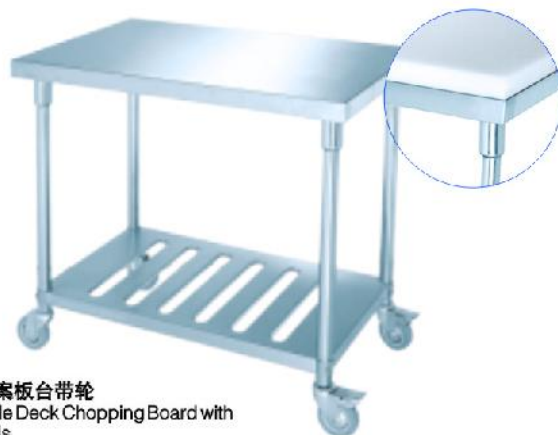
双层案板台带轮 Double Deck Chopping Board with wheels 73C02 立方数 m 3 :0.06 重量 N.W.:16kgs 规格 Size:900x600x850mm 尺寸 Measurement:920x620x100mm